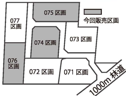
アメリカンビレッジ追分 区画図